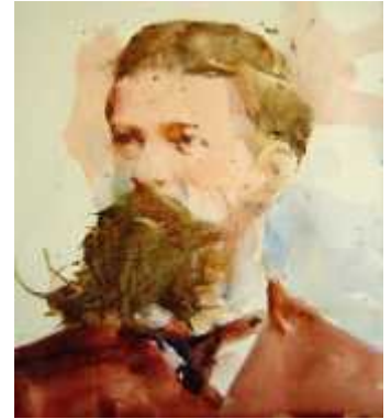
Charles Sanders Peirce (1839 - 1914)

Para Peirce, as realizações humanas configuram-se no interior da mediação da linguagem em seu sentido mais amplo. Para ele, não é possível qualquer ato de cognição a não ser que seja determinado por uma outra cognição prévia, na medida em que todo pensamento implica a interpretação ou representação de alguma coisa por outra coisa. Desta maneira, todo pensamento está inextricavelmente ligado às funções de representação por não ser capaz de interpretar a si próprio. Esta interpretação deve se realizar somente por meio do signo.